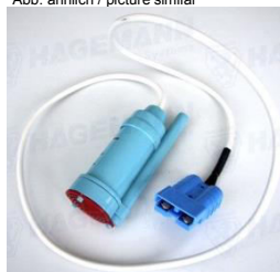
Abb. ähnlich / picture similar

Tauchpumpe mit SB 50 Stecker 400BAMS632 pump with SB 50 plug