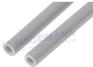
Abbildung / picture