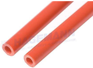
Abbildung / picture