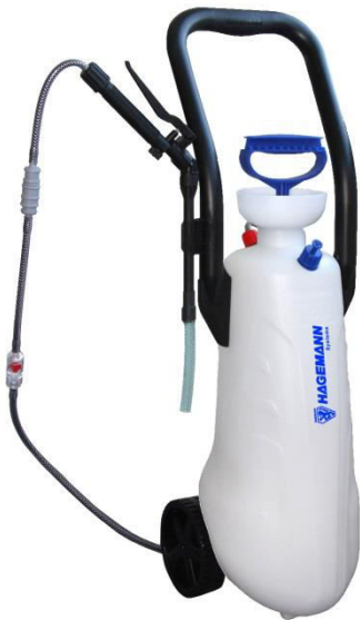
Abbildung / picture