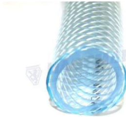
Abbildung / picture

weitere Größen auf Anfrage further sizes on request